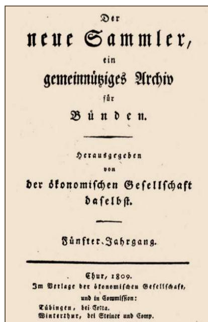
La revista «Der Sammler» è cumparada ils onns 1779–84 e 1804–1812.